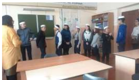
Презентация специальности «Логист – это маркетолог, менеджер и экономист в одном лице»