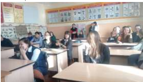
Станция «Бон аппетит»