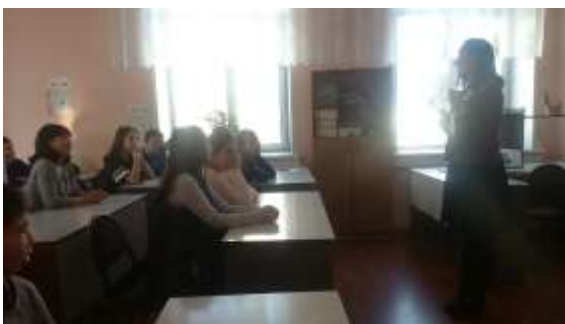
Станция «Дебет и кредит»