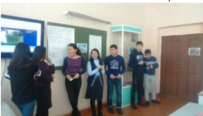
Станция «Юные экскурсоводы»

Ребята встретились с преподавателями техникума. Получили информацию о приемной комиссии и познакомились с новыми профессиями и специальностями.