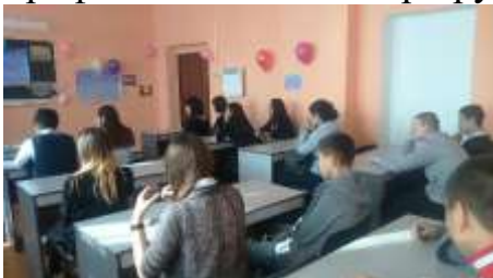
Станция «Человек и Закон»

Это мероприятие традиционно проходит как путешествие по станциям. И каждая станция – это маленькое открытие на пути выбора профессионального маршрута.